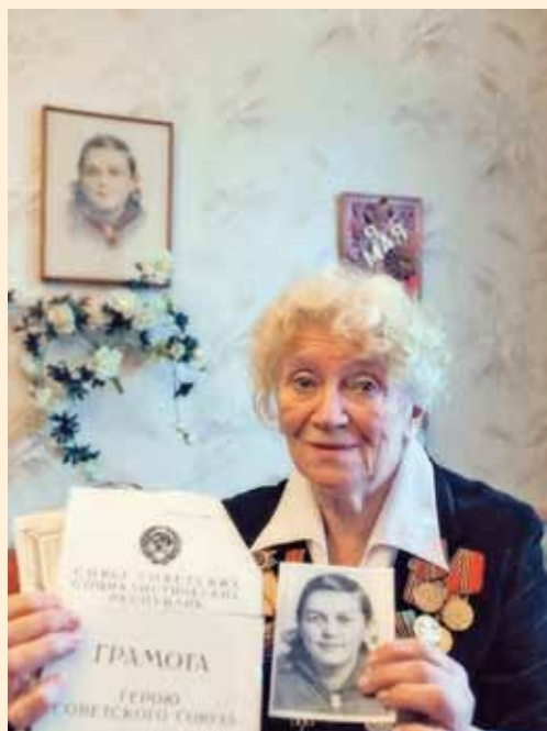
В музее Зины Портновой

1 июля 1958 года Зинаиде Матвеевне Портновой было присвоено звание Героя Советского Союза (посмертно).