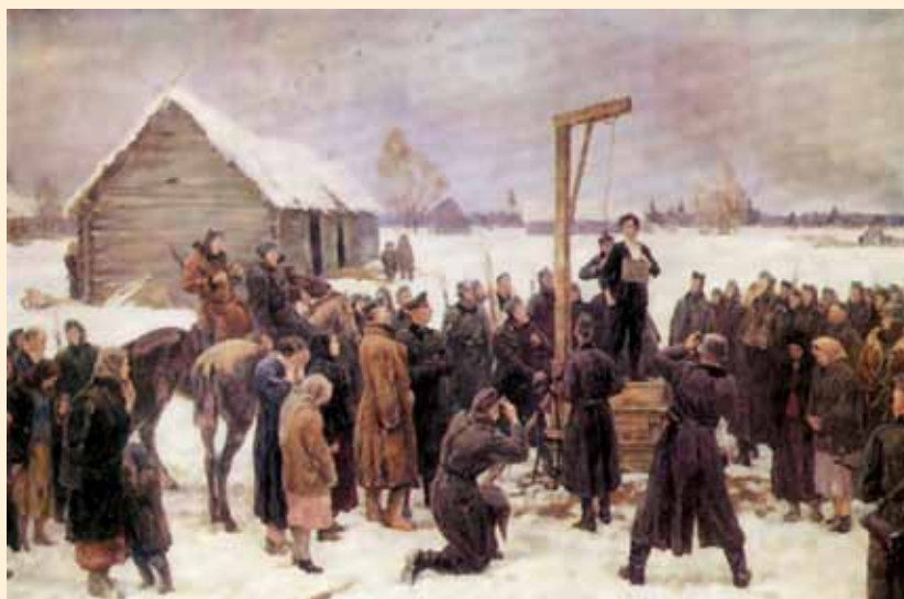
Таня (Подвиг Зои Космодемьянской). Кукрыниксы. 1942 г.

Похоронена Зоя Космодемьянская в Москве на Новодевичьем кладбище.