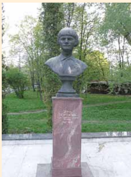
Бюст Зины Портновой. Москва. ВДНХ